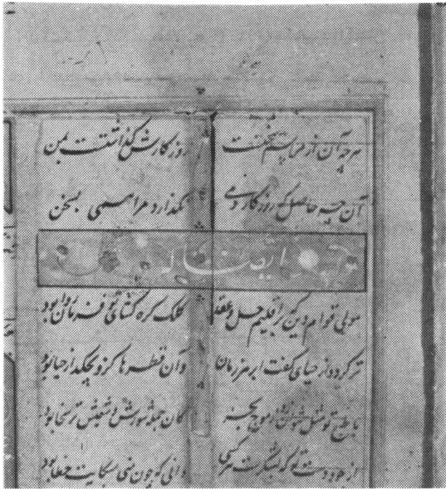
تخریب زنگار در حاشیه یک نسخه خطی قرن هفدهم